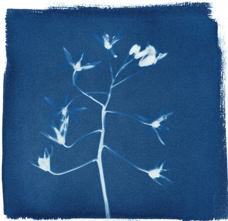
Јана Луловска Матисовиот танц , 2022 Цијанотипија, Фотограм 24 x 24 cm