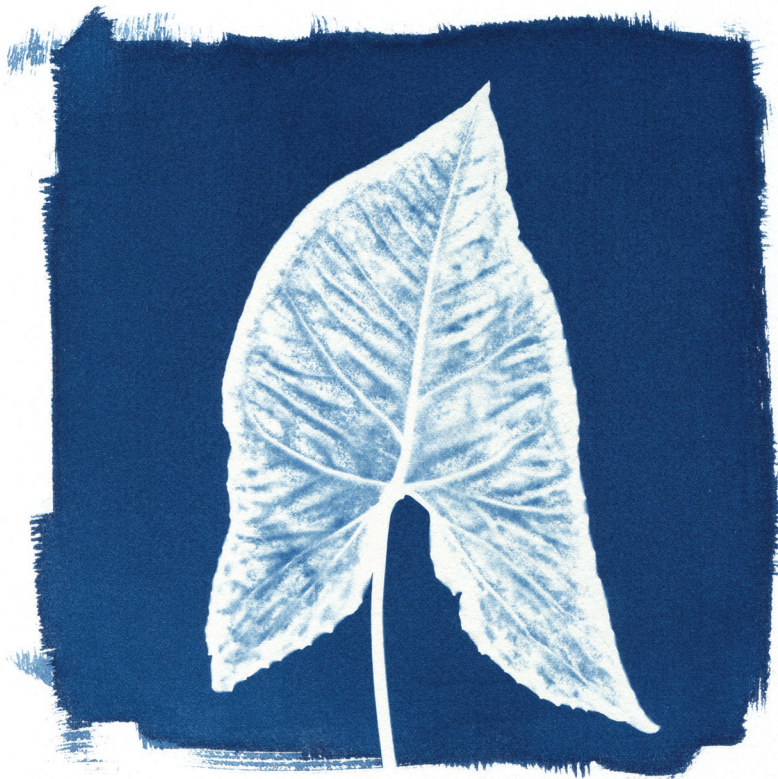
Јана Луловска Возбуденост , 2022 Цијанотипија, Фотограм 25 x 25 cm